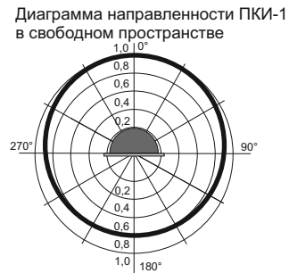
Рис.2 Диаграмма направленности оповещателя ПКИ-1.

5.3. На рис.2 показана диаграмма направленности звука оповещателя ПКИ-1.