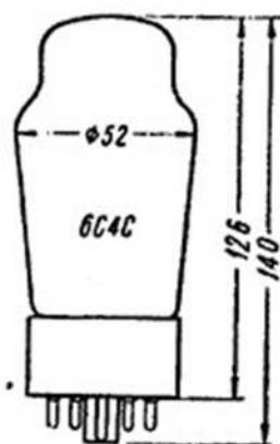
Рис. 467. Лампа 6C4C: а — основные размеры; б — схематическое изображение; 1, 4, 6 и 8 — свободные; 2 и 7 — подогреватель (накал); 3 — анод; 5 — сетка.

Предназначен для усиления мощности низкой частоты. Катод оксидный прямого накала. Работает в любом положении. Выпускается в стеклянном оформлении. Срок службы не менее 500 ч. Цоколь октальный с ключом. Штырьков 8.