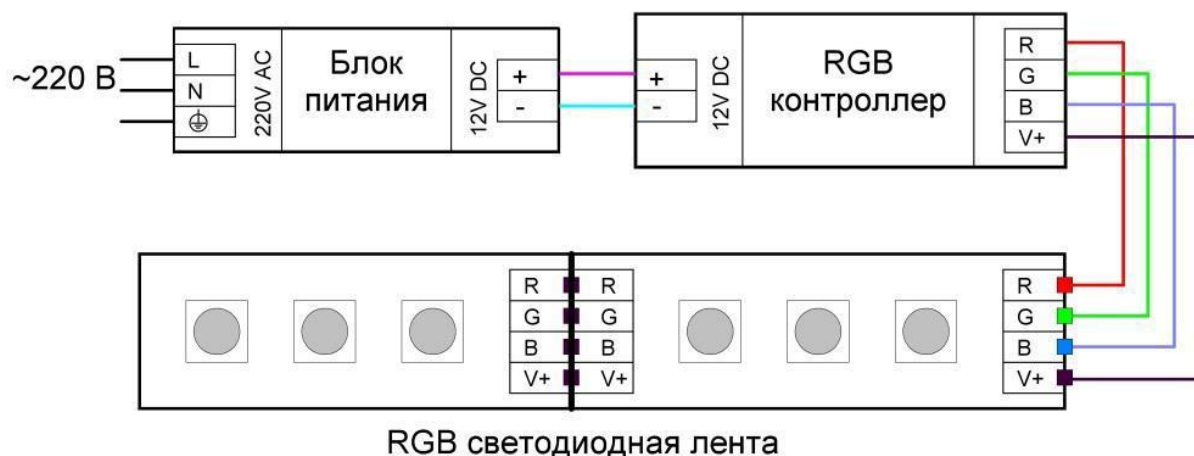
Подключение RGB светодиодной ленты

Контроллеры бывают разные по внешнему виду, мощности, программам управления цветом и пультам дистанционного управления. Но принцип везде один. На контроллер приходит 2 провода от блока питания, а уже от контроллера уходит четыре провода на RGB-ленту. Которые правильно подключаем согласно маркировке на концах провода и ленты соответственно: