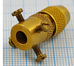
отв. диаметр 5,0мм