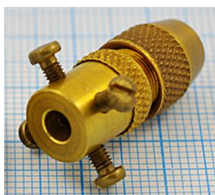
отв. диаметр 4,0мм