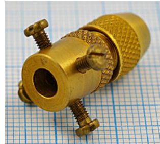
отв. диаметр 5,0мм