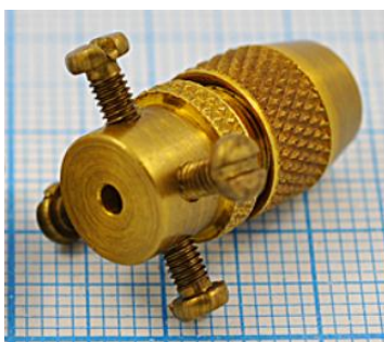
отв. диаметр 2,0мм