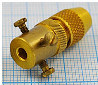
отв. диаметр 3,5мм