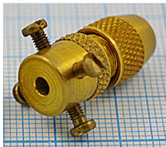
отв. диаметр 3,0мм