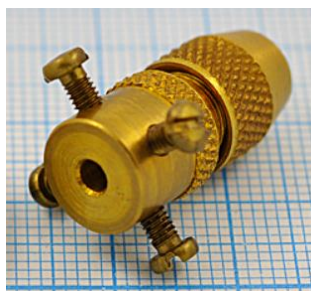
отв. диаметр 2,8мм