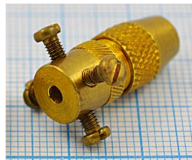
отв. диаметр 2,5мм