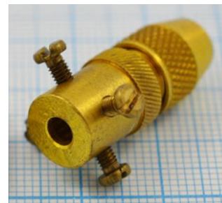
отв. диаметр 3,8мм