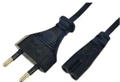
Артикул Q-3069 (прямой)