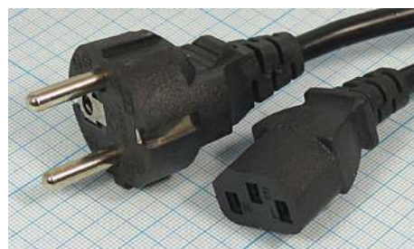
Артикул Q-3066 (прямой)