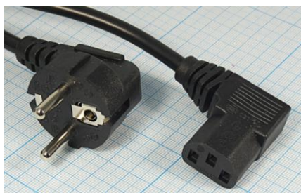
Артикул Q-3066У (угловой)