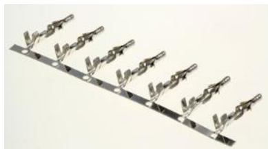
Контакты для TU-...F