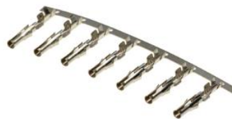
Контакты для TU-...M